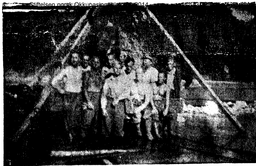
Fotoet er tatt våren 1949 og taler sitt tydelige språk om tvangsarbeide i Norge