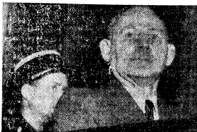
Den 16. mars ble general Ramcke stilt for en militærdomstol i Paris. Bildet viser Ramcke i tiltaleboksen.

Vi gjengir her en beretning om den skammelige behandling som den 60 år gamle general er blitt tildelt. Det er i sannhet et mørkt blad i seierherrenes historie.