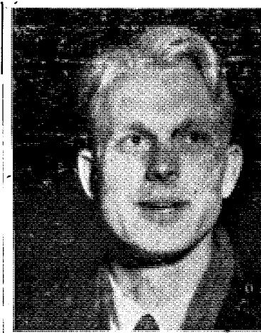
Hatten av for arkitekt Sverre Fehn, Oslo. Sannelig vant han også konkurransen om Norges Bryssel-paviljong til verdensutstillingen 1958.

Det medfulgte på Värmlandsturen deltagere fra Oslo, Akershus, Vest-Agder, Aust-Agder, Buskerud og Vestfold.