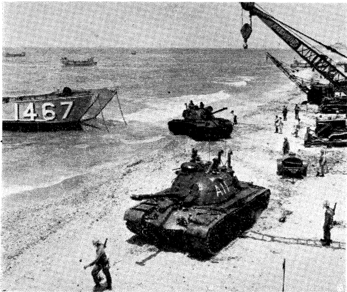
Her er det amerikanske tropper som «sikrer freden», andre steder gjør bolsjevikene oss denne tjeneste.

«Mens alle disse skrekkelige omveltninger foregikk i Europa, kjempet Gefreiteren Adolf Hitler sitt lange trettende slag om det tyske hjerte. Denne kamps historie kan ikke leses uten med beundring for det mot. den oppriktighet og den kraft i personligheten som fikk ham til å utfordre, å trosse, å overvelde og å forsonne — iallfall til å sette sitt igjennom overfor alle autoriteter og all motstand fra dem som sperret ham veien. Han og den stadig voksende skare av dem som sluttet seg til ham, viste i sin patriotiske ild og sin fedrelandskjærighet at det ikke fantes noe som de ikke var beredt til å gjøre eller å våge. intet offer av liv, sunnhet, frihet som de ikke selv ville bringe eller ville pålegge sine motstandere».