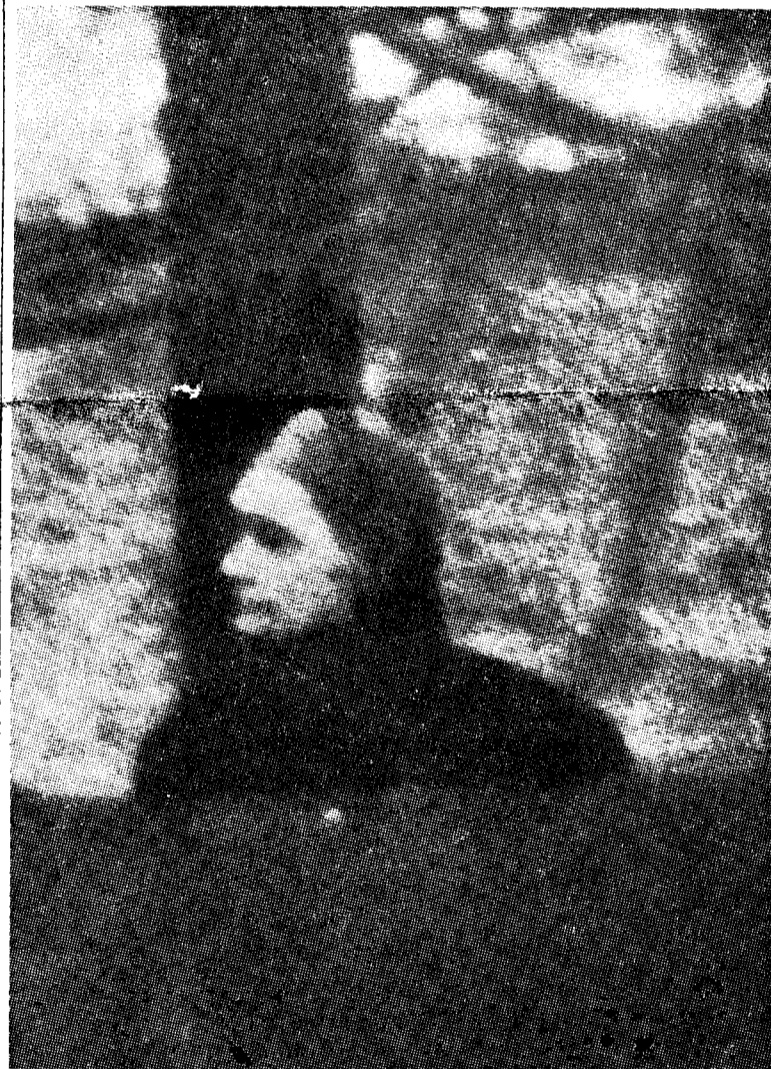
Rudolf Hess fotografert i fengselsgården i Spandau med teletinse. (Fra boken «Gefangener des Friedens»).

Et sted må begynnelsen gjøres til den moralske revisjon som verdens dårlige samvittighet venter på