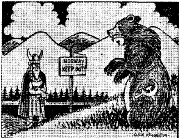
Utlandets syn på kongestatuen på Finnmarksvidda!