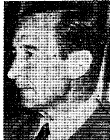
Peron eller Aramburu?