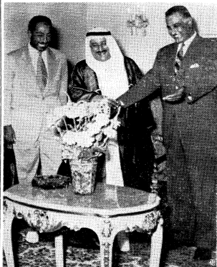
President Nasser med arabiske venner.