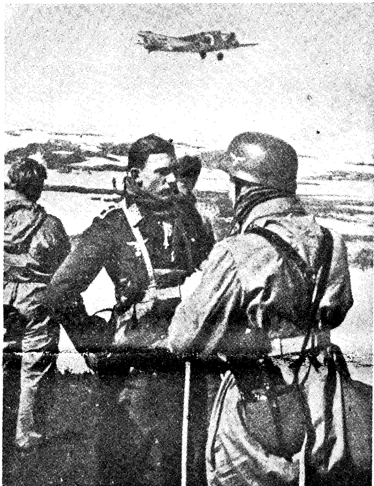
Tyske falmskjermsoldater landsatt bak de norske linjer — fra Værnes eller Fornebu.