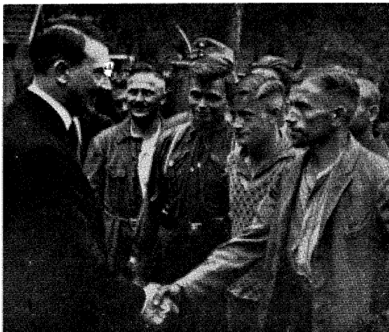
Hitler i k retsen av tyske arbeidere