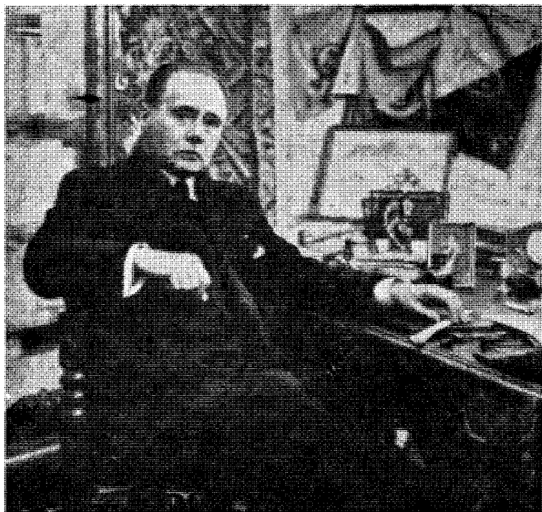
General Gamelin — dikter og fjuvør, men ingen stor hærfører