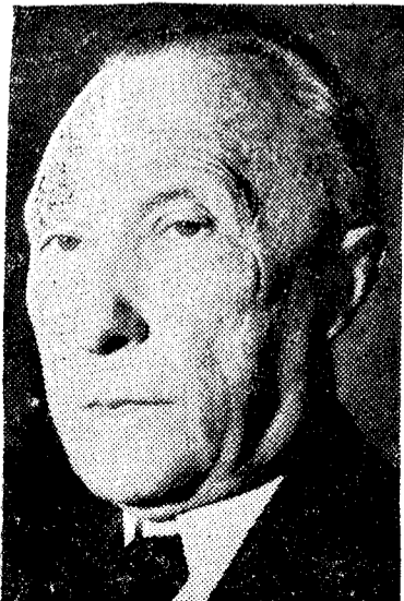
Ønsker ikke Adenauer tysk gjenforening?