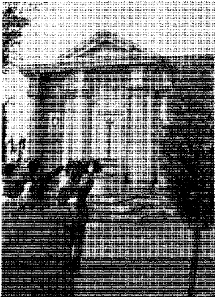
Onesimo Redondos grav på kirkegården i Valladolid

Kastilias myrdede falangistleder ONESIMO REDONDO