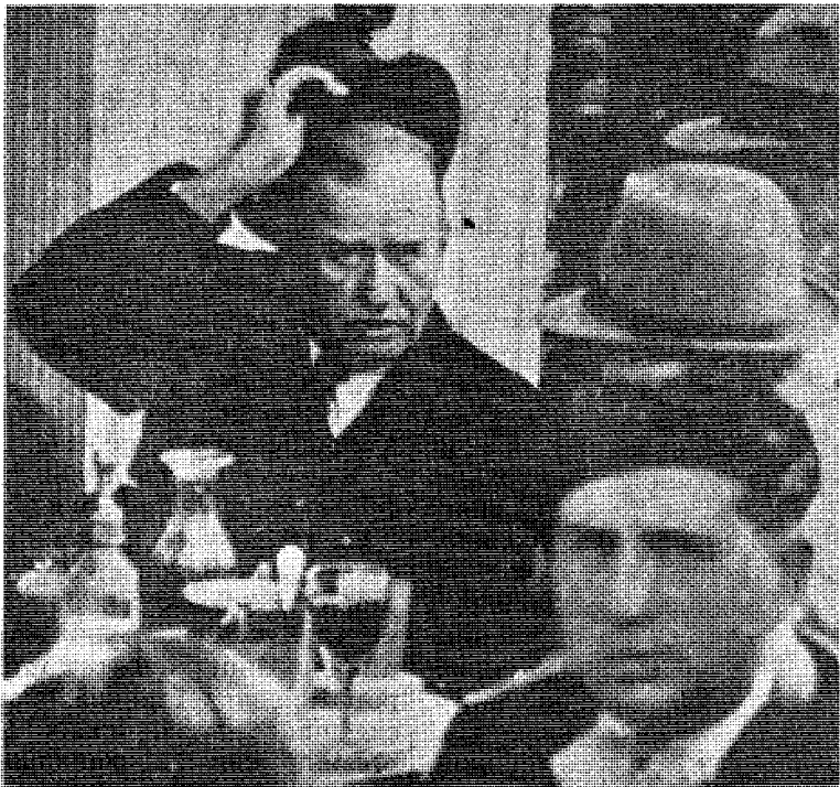
Daladier er grepet av frykt for fremtiden og søker trøst i absinten

20. september 1939. — Den franske ministerpresident Edouard Daladier er grepet av gru. Riktignok har han i denne krigens første måned oppnådd det han alltid har ønsket seg: etter det merverdige møte i kamret da «militærkreditten» ble bevilget har det ikke vært innkallt, og Daladier er dermed Frankrikes uinnskrenkede hersker. Dessuten har han kvittet seg med Bonnet og nå er han selv både utenriks- og krigsminister og har dermed større makt i hendene enn noensinne. Men disse fryktelige hendelser i Polen! Denne uhørte tyske krig, som i løpet av tre uker har slått hele Polens militære makt i stumper og stykker — seir på seir, og nå, hva nå når denne makt vender seg fra øst mot vest, fra Polen til Frankrike?! Og i denne gru, i denne frykt for fremtiden søker Daladier etter hjelp. Bare en militær kan gi ham det — men plutselig ser han med gru også på Gamelin, der: diskrete, sakte talende lærde som aldri har gjort ham noen vanskeligheter (av den grunn kaller offiserene ham også «General Javel minister») — Hvem skal han vende seg til? Er har jo Weygand — men har han ved krigens begynnelse sendt avsted til Syria. Han ville helst ha ham lengst mulig vekk, for hans biske bemerkninger var så ubehagelige. Så har en jo marskalk Pétain, en hedersmann, en general fra den store krig. Inntrengende ber han marskalken om å avlegge ham et besøk.