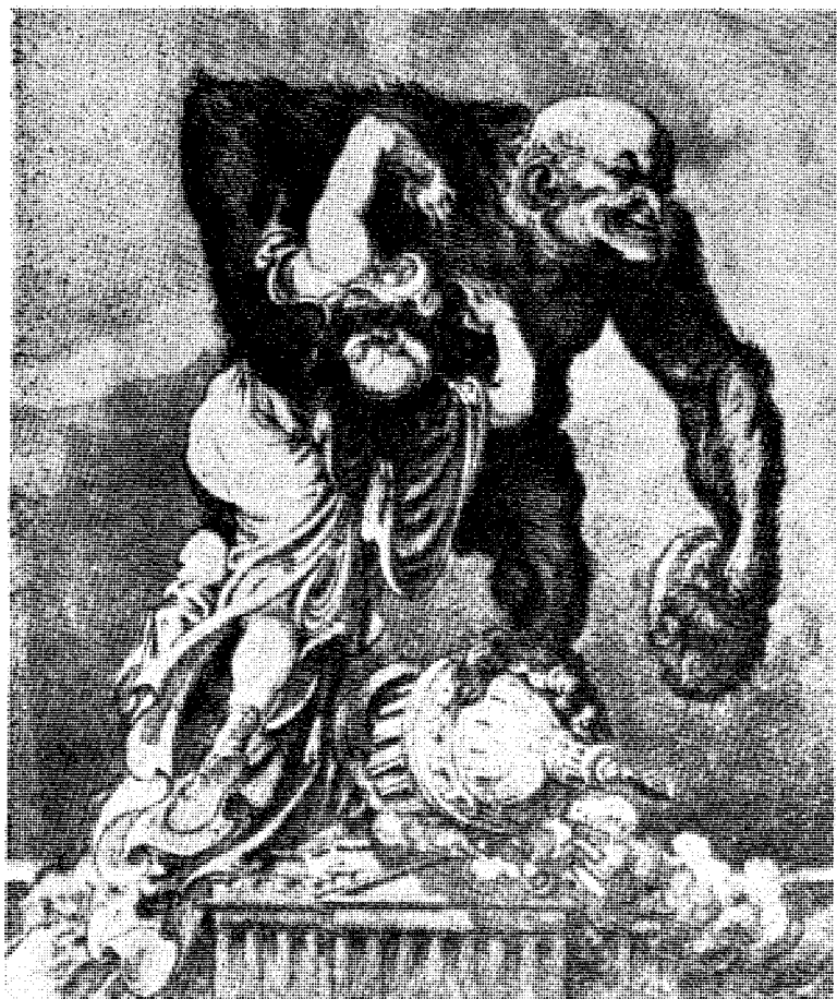
Kampen mot sannheten og ytringsfriheten er ikke oppfunnet av lærerklikken. Den er like gammel som menneskehetens historie