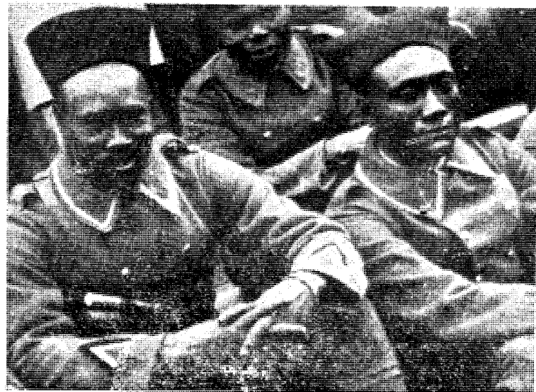
«Vi vil være overveldet innen hundre år — — —»