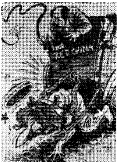
Kinas befolkning økte med 15 millioner i 1958

Det faktum at de nordiske folk overalt i verden begrenser sin tilvekst, og at økningen i verdens befolkning har sitt tyngdepunkt i de tropiske og asiatiske land, akkurat slik som Lothrop Stoddard sa at det vilde gå i «The Rising Tide of Colour» og som Madison Grant bebudet i «The Passing of the Great Race», som ble offentliggjort for første gang for femogtyve år siden, antyder den eventuelle tilintetgjørelse av vår rase hvis vi ikke blir klar over faren. Disse land med hurtig økende befolkning, og det er mange av dem, søker en øyeblikkelig løsning av sine problemer ved å sende overskuddet vekk til andre land, hvor befolkningstettheten enten ikke er så stor eller produktiviteten er større, slik at det kan absorberes en større befolkning ved at levestandarden senkes jevnt over. Resultatet i denne verden med hur-