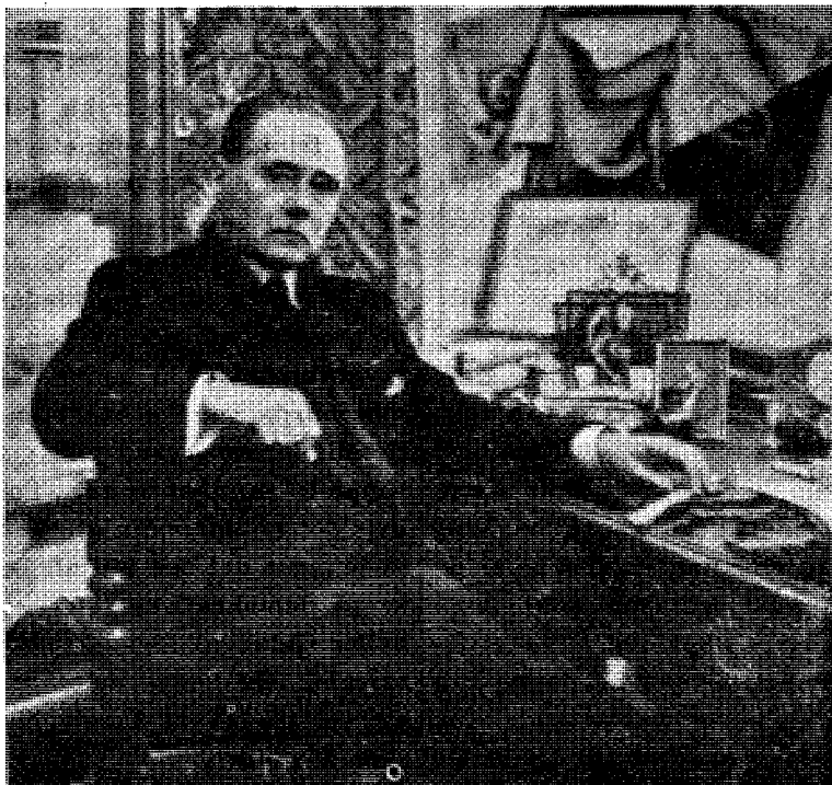
General «Javel minister»