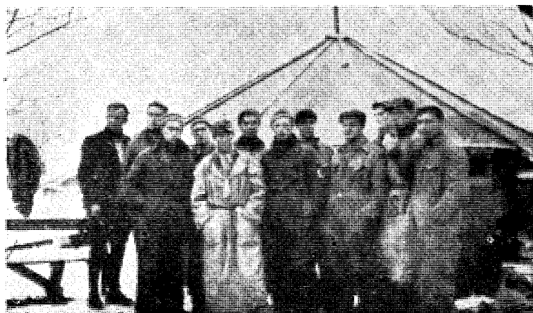
De siste på skansen i Kirkenes før de undertegnet erklæringen om medlemskap i Lærersambandet og etter at de hadde hjulpet Terboven i kampen mot Quisling.

Lærerne tror øyensynlig at de har kjempet mot Reichskommissar Terboven og mot tyskerne, og de tror at de har gjort en innsats for Norges «frigjøring» under krigen i 1942. De har også klart å