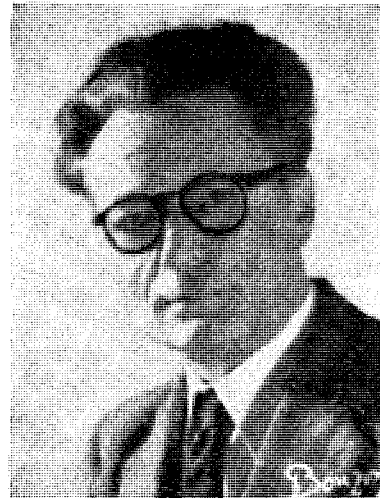
Professor dr. Paul Rassinier

I Russland (Karaganda) — sier Margarethe Buber-Neu- mann — var det det samme. I Italia under Mussolini (Li- pari) og også i Spania (Mi- randa) Grekenland etter krigen, og også i Frankrike etter krigen i leirene for pé- tainister (La Noé, Carrère o.s.v.), og fremdeles den dag