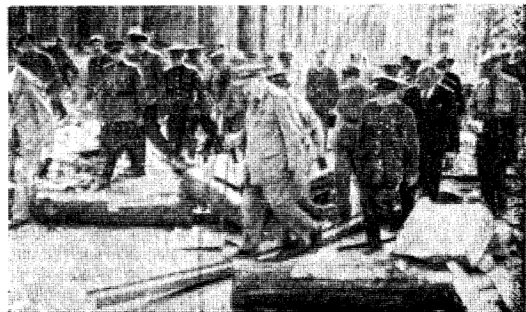
Triumfens time for Churchill: På Europas ruiner. Men så kom eftertankens kranke blekhet