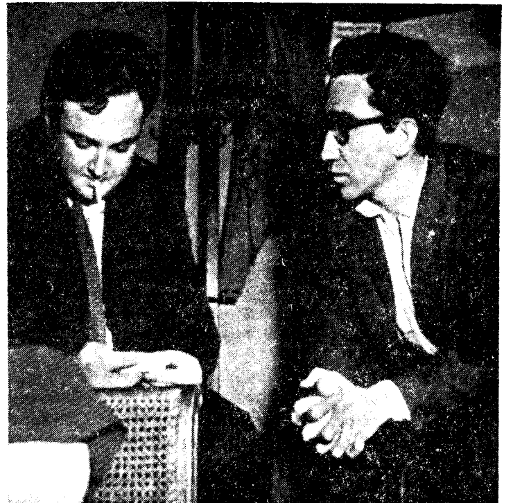
Lederne for studentorganisasjonen Tacuara og samtidig de meget unge stiftere av det nye argentinske parti Union Civid Nacionalista

Avisen «Jedioth Chada-choth» i Tel Aviv skrev før jul ifjor blant annet: «I Latinamerika er det en ny fare, fidelismen, kalt slik etter Fidel Castro, Cubas diktator. Han har funnet en form for kommunisme, som er mere tiltrekkende for latinamerikanerne enn urkommunismen fra Moskva. Og den jødiske ungdom blir grepet av denne strømning i tiden. I de fidelistiske kretser dominerer jødiske «edekommunister». Vi kjenner igjen disse foreteelser fra Weimarrepublikken — I La-