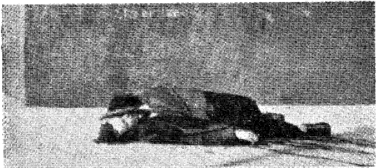
Spesielt forbudt er naturligvis snikmord som krigsmiddel

OM DE HANDLINGER SOM I DAG FORHERLIGES I SKRIFT, TALE OG FILM I NORGE OG ANNETSTEDS