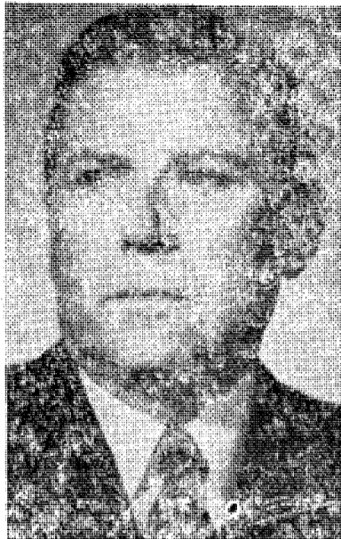
Den uheldige lagtingspresident, som plumpet ut med sannheten om «rettsoppgjøret».

Menneskerettighetserklæringen ble vedtatt av FN's hovedforsamling 10. desember 1948. Erklæringen består i 30 artikler de rettigheter som tilkommer enhver menneske, bla. likhet for loven, rettsikkerhet, rett til politisk oppfatning, ytelsesfrihet m. m. I 1950 vedtok Europarådet, der Norge står tilsluttet, en forpliktende konvensjon om menneskerettighetene. En domstol er senere blitt opprettet til å håndheve konvensjonens bestemmelser. Som kulturfolk med utproget demokratisk samfunnsordning, demokratisk innstilling, frihets- og rettsfølelse og human livssyn vil vi stå som eksempel for andre nasjoner.