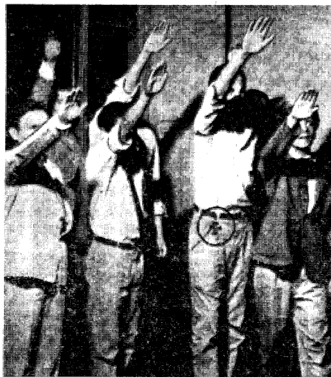
Det er disse ungdommene i Argentina som nå føler seg frust av. Den argentinske avis skriver som understreket: «Unge Tacuara-studenter: Ved dette tegnet skal du seire». (Dette «tegnet» er krusifikset. Hilsenen med oppstrakt åpen hånd kaller de den fri manns hilsen).

Allerede da han i utdrag offentliggjorde resultatet av sine undersøkelser for to år siden i «Der Spiegel», ble det noe av en verdenssensasjon, selv om de norske aviser med vanlig forakt for sannheten når den ikke passer inn i mønstret unnlot å omtale det. I virkeligheten var med ett