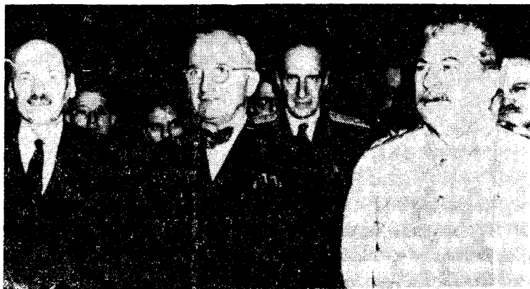
Tre «store» i Potsdam 1945: Attlee, Truman og Stalin

overrasket ikke bare i Tyskland, da den tidligere britiske premierminister Churchill i en tale forkynte at han i dagene for den tyske kapitulasjonen i 1945 hadde gitt feldtmarskalk Montgomery den telegrafiske anvisning omhyggelig å samle de tyske våpen og å stable dem slik at de igjen lettvis kunne deles ut til de tyske soldater, med hvem vi måtte ha samarbeidet hvis den sovjetiske fremmarsj hadde vedvart.»