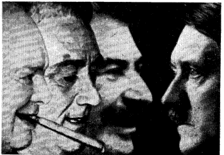
De fire store hovedaktører i den europeiske tragedie