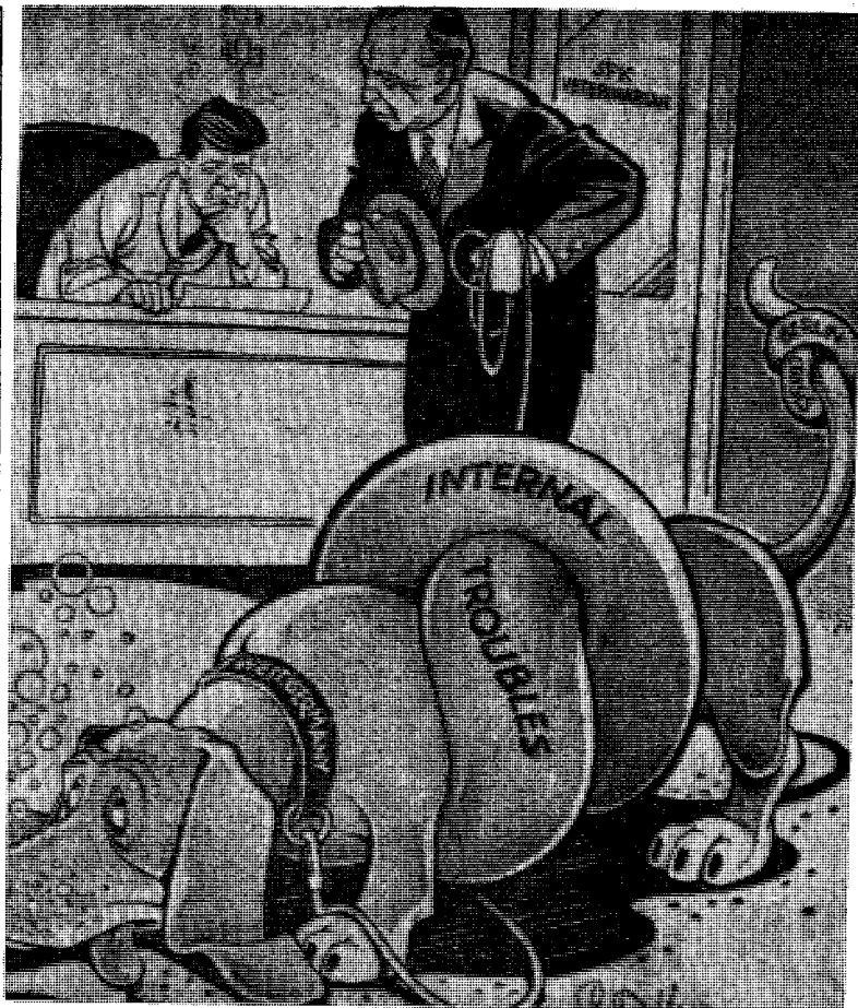
Slik ser en amerikansk avis på verdenssituasjonen. «Hva foreslår De?» spør Adenauer «doktor» Kennedy.

Å delta i noe amerikansk korstog mot en kommunisme som korsfarerne selv har sloppet løs, kan ikke være noen oppgave for det lille norske folk i dagens situasjon. Vi har dessuten alt ydet vårt bidrag til dette korstoget, for en skal ikke glemme at Norge mistet 800 unge nasjonalbevisste og frivillige korsfarere