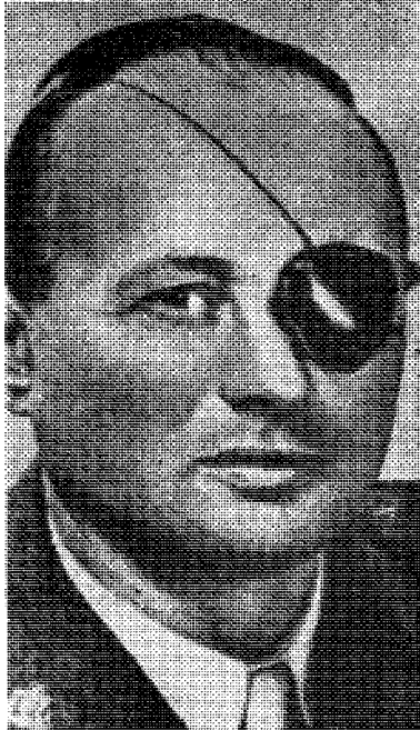
Moshe Sharett avløste Ben Gurion en kort tid — offisielt

En artikkelserie av den jødiske anti-zionist Moshe Menuhin