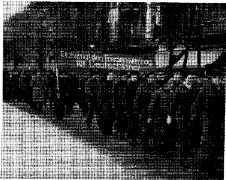
Og i øst, er ønsket det samme: et gjenforenet og gjenoppstått...