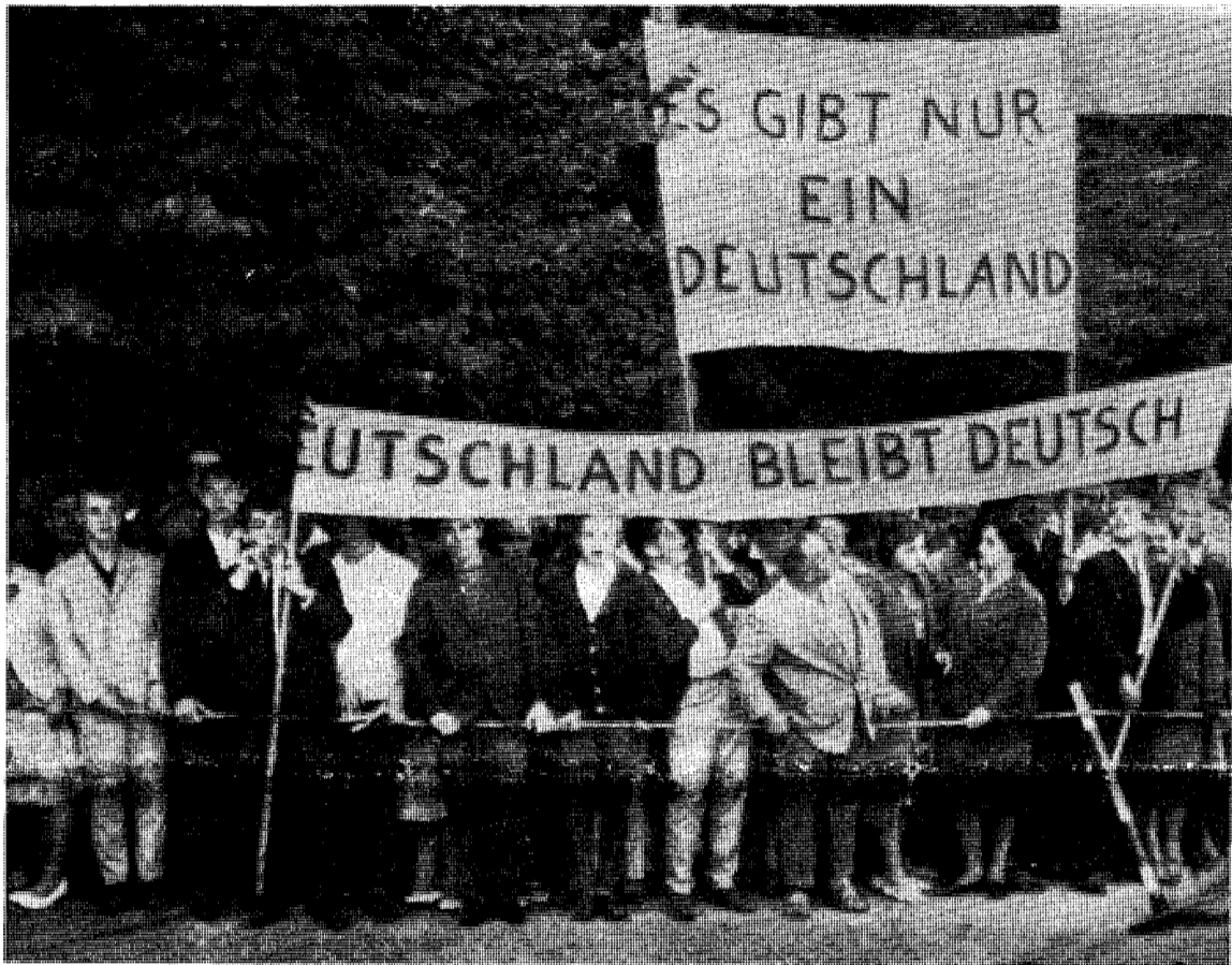
I vest — — —

Bakgrunnen for de russiske diplomatiske følere overfor Vest-Tyskland