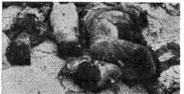
Ben Gurions regjering ble ikke sjokkert over terroren mot araberne — —