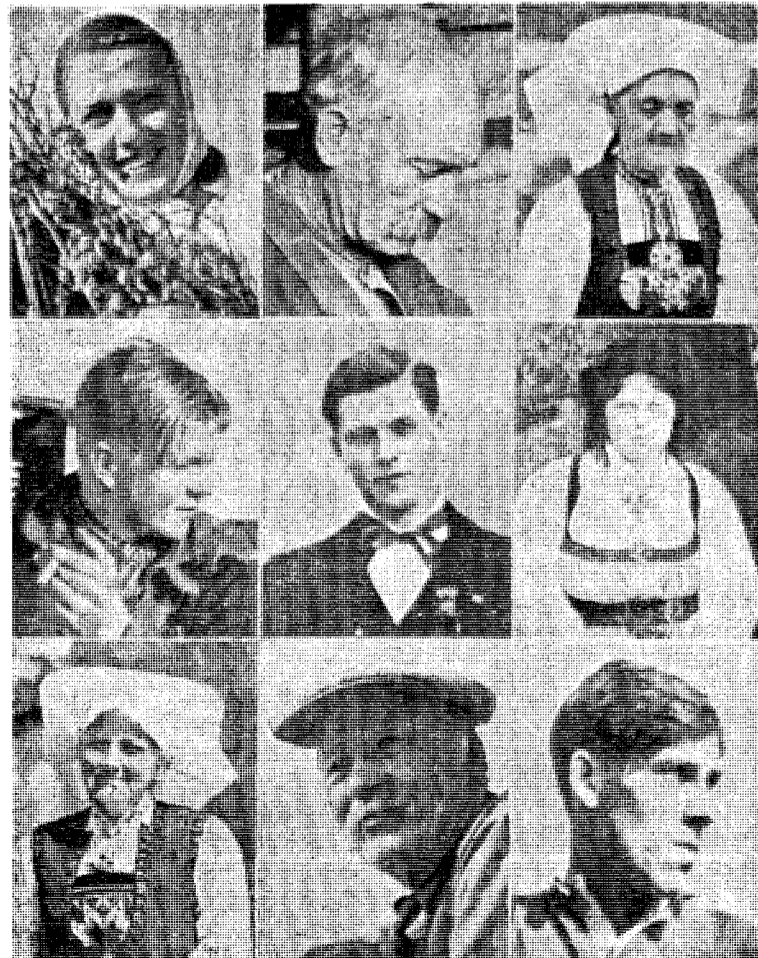
Var egen rase