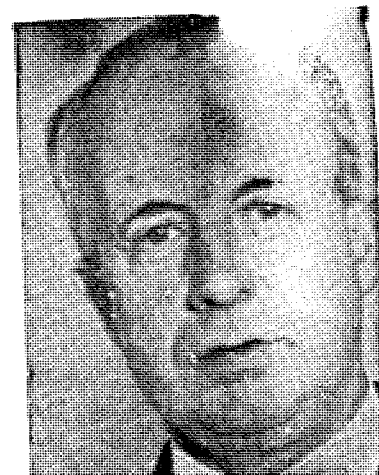
«Paal Berg presiderte i Høyesterett i Quislingsaken».