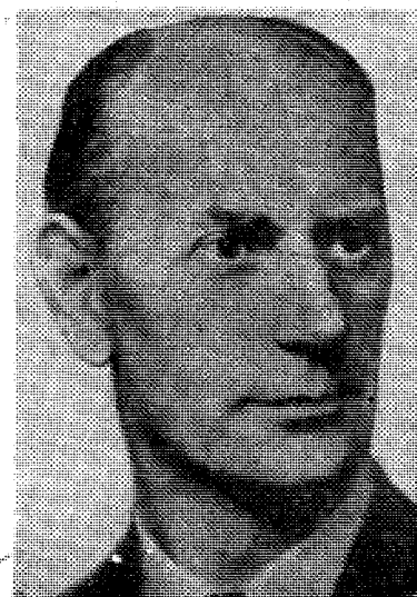
«Einar Gerhardsen påtok seg å legge fram benådningssaker i statsråd da justisministeren hadde frabedt seg jobben».

frakommelig er det at England brøt internasjonal overenskomst da det 16. februar 1940 krenket Norges nøytralitet i Jøssingfjord. Det heter nemlig i Haagkonvensjonens «Overenskomst XIII» punkt 2: «Alle fiendtlige handlinger, oppbringelse og utøvelse av visitasjonsretten iberegnet, begått av krigførendes krigsskip i nøytral makt territoriale farvann, utgjør en nøytralitetskrenkelse og er strengt forbudt.» Her praktiserte England ikke sitt gamle slagord: Honesty is the best policy eller som vi pleier å si det: Ærlighet varer lengst.