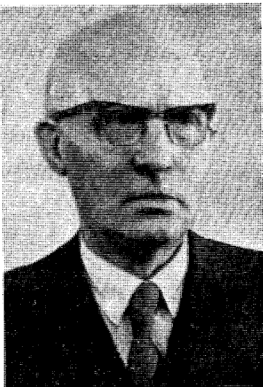
Prost A. E. Hedem, som her holder oppgjør med uretten.

Om England og Frankrike fulgte folkerettens regler da de september 1939 erklærte Tyskland krig, skal vi ikke komme inn på her. Men u-