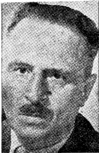
Sir Oswald Mosley