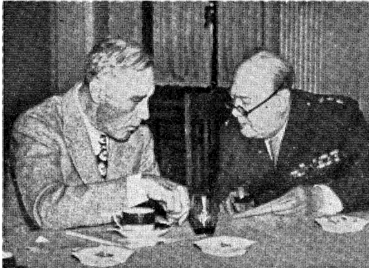
Churchill sjakerer bort det britiske imperium.

Dagspressen kunne for en tid siden med dårlig skjult tilfredshet melde at lederen for det britiske parti «The British Union» Sir Oswald Mosley under et offentlig møte var blitt slått ned av organiserte urostiftere. At det Mosley har å si virker som salt i sure øyne på bakgrunn av dagens situasjon er kanskje forståelig av disse utdrag av en artikkel i Mosleys blad ACTION: