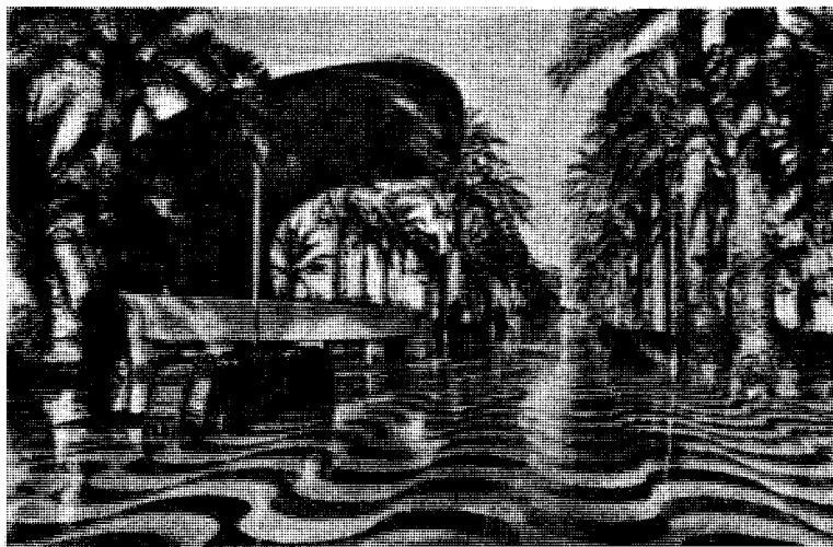
La Explanada, byens flotte strandpromenade

SPANIA-BREV TIL «FOLK OG LAND» FRA LEKTOR PH. BING