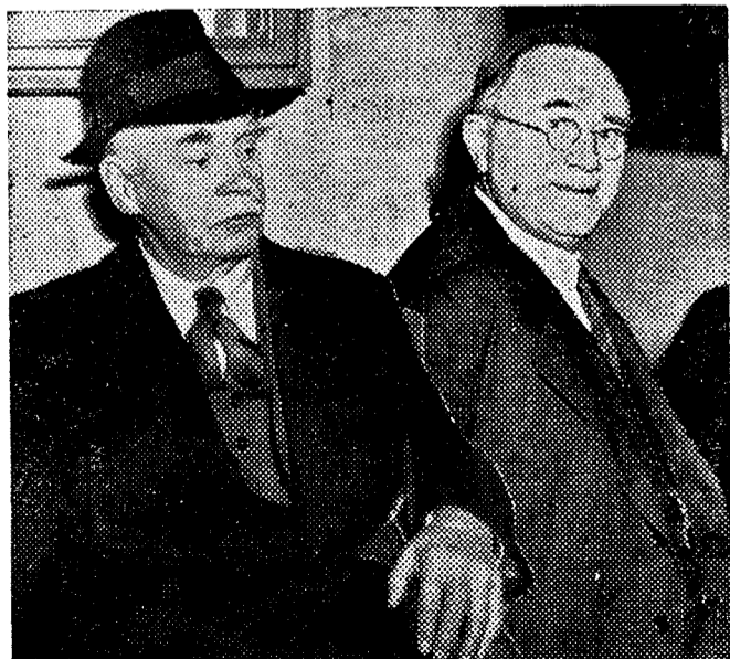
Den forutseende utenriksledelse

Narvik kan på denne måte bli utsatt for angrep fra