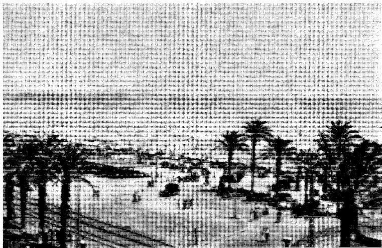
Playa del Postiguets, Alicante's badestrand