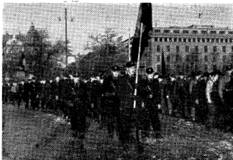
Et karakteristisk bilde fra okkupasjonstiden: Quislings hird marsjerer. Det var ikke bare urostiftere som mislikte denne organisasjonen, også tyskerne så på den med mistro som en norsk maktfaktor