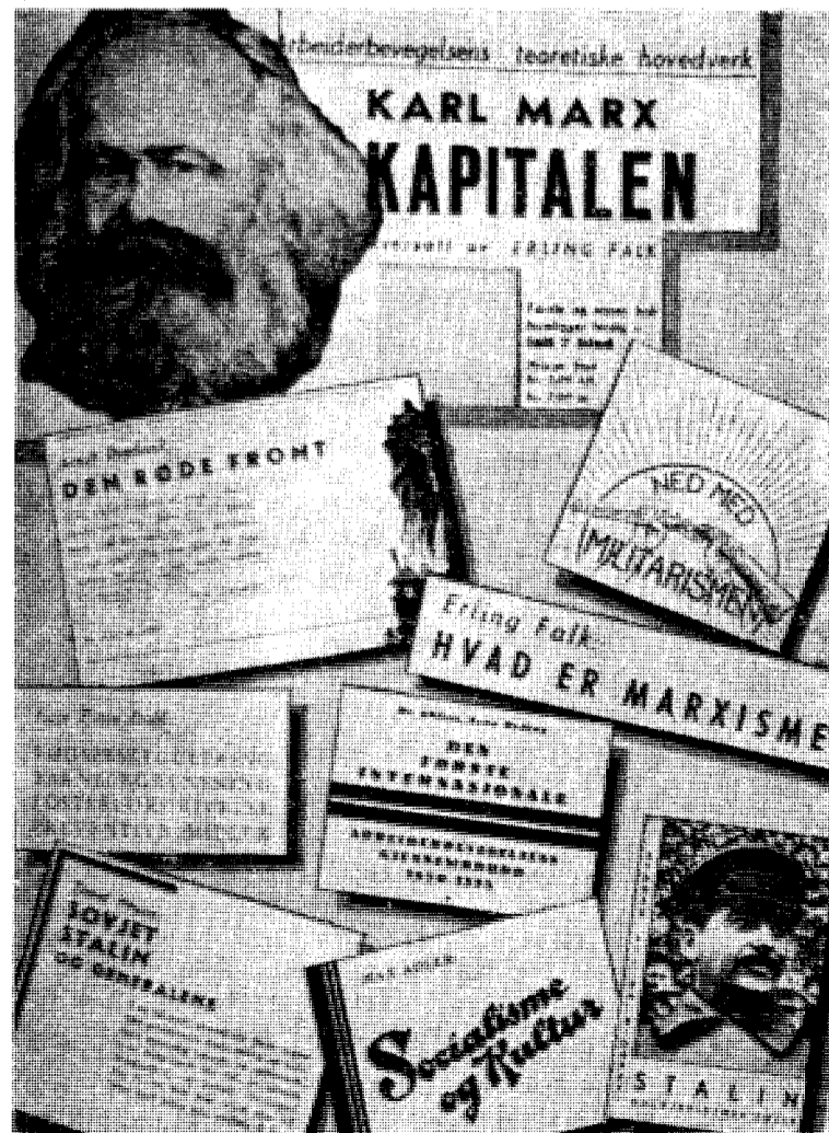
Ne av den litteratur som førte frem til 9. april 1940. Blant annet ser man Arbeiderpartiets brukne gevær.