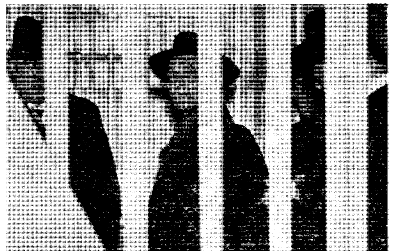
Stortingsmedlemmene besøkte i slutten av januar 1934 Bods-fængslet i Oslo. Her er et bilde av noen stortingsmenn fotografert bak gitteret. Det er mange som mener at de burde ha forblitt der etter å ha lagt Norge forsvarsløst og dermed ført oss opp i 9. april 1940.