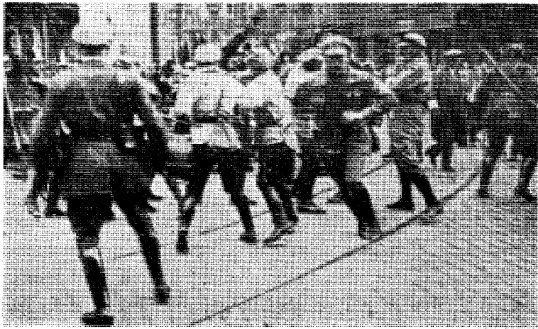
Bare i 1930 ble 735 menn og 498 kvinner i Tyskland myrdet av de røde.

Engang under krigen sa Winston Churchill til sine landsmenn: