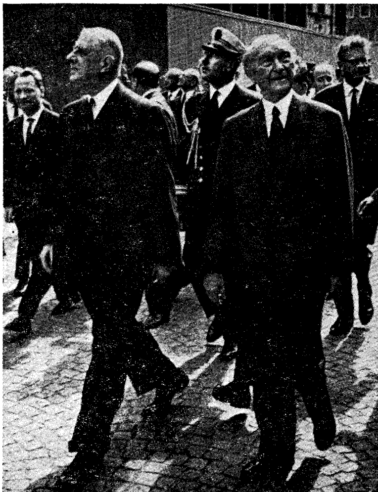
Når de Gaulle för någon tid sed n om att upprepa «den fransk-chen, var han mycket angelägen om att upprepa «den fransk-bayerska vänskapen» o.s.v.