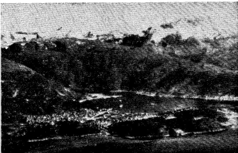
Narvik sett fra nord. I bakgrunnen Ankenes og innløpet til Beisfjord