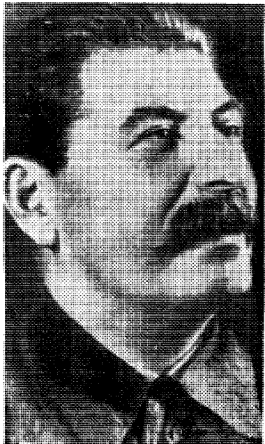
Tilslutt satt Stalin alene igjen på toppen som eneveldig despot

Ved å lese denne bok får man det klart for seg at Stalin hverken var kommunist eller marxist, men rett og slett en bolsjevik med hele bolsjevismens samfunnsødeliggende moral og politikk, som gikk ut å å skape kaos i alle vestlige stater. For uten kaos kan bolsjevismen ikke bestå. Herunder gikk det varmt for seg særlig i Tyskland, som Stalin betraktet som et brohode for sin inntrengen i Vesten. Her var det i 1930 3 millioner arbeidsløse, 17,830 mennesker begikk selvmord og 735 menn og 498 kvinner ble myrdet av