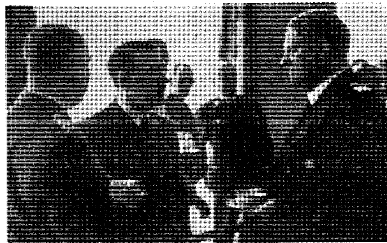
Quisling påpekade inför Hitler personligen Hitlers stora misstag att ringakta de östeuropeiska folkens dynamiska krafter och antikommunistiska innställning