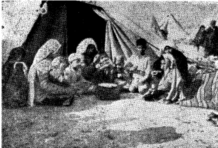
Fordrevne arbeidere stirrer mot hjemlandet Palestina — —

NER (en hebraisk månedssavis utgitt i Jerusalem for «jødisk-arabisk tilnærming») hadde i sin utgave for november-desember 1956 dette å si om det militærregime som styrer Israel, om angrepet på Egypt og pogromen i Kafr Kassim: «Rådet for IHUD merket seg med sorg og smerte den bedrøvelige kjennsgjering at Israel blandet seg inn i en aksjon sammen med makter oppsatt på utnyttelse av etterliggende folk, og dermed inviterte til å bli kalt et redskap i hendene på disse makter. England og Frankrike vil forlate det nære østen før eller senere, enten frivillig eller tvungent. Men vi lever midt i