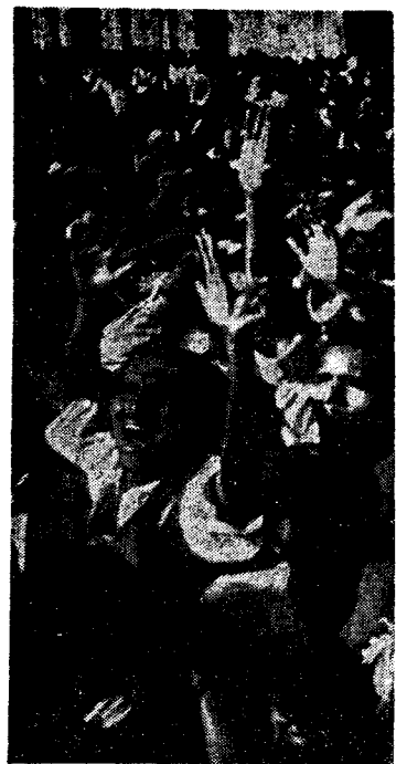
London av dag: 25 000 pakistanske km til England i løpet av de første ti måneder av 1961. Av vestindere var det 58 000.

Så uløselig er dette problem (Forts. side 5)