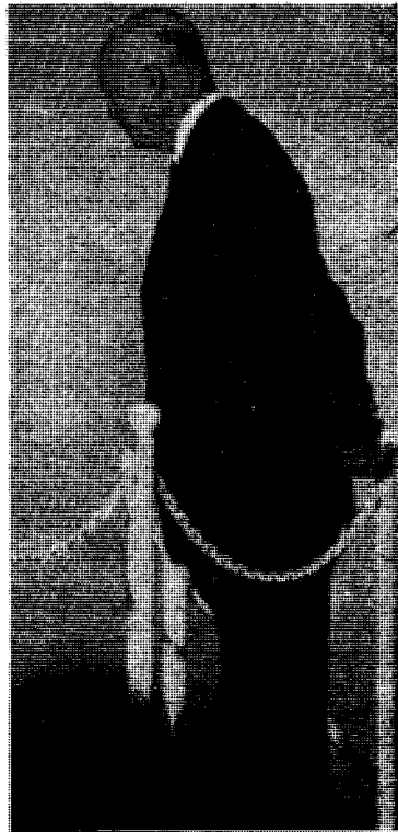
I otte år spilte han golf og tok imot verdensberømteter — —

Opprørerne på vei til Cuba hadde ingen muligheter for å