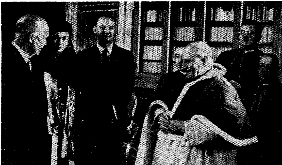
Eisenhower stod også på en god fot med Vatikanet. Her motus han av paven.