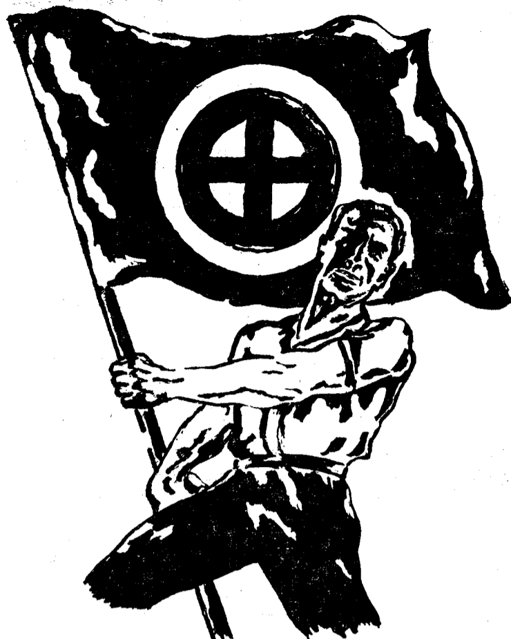
Dette forekommer vel våre lesere selsom bekjent, men det er ikke en plakatt fra NS Ungdomsfulking. Det er det britiske National Party som nå — forøvrig sammen med andre bevegelser i nordiske land — fører solkorset som sitt merke.

Det som nå står tilbake er ikke å klarlegge disse kjennsgjerninger, men å fordele ansvaret der det skal være, slik det forsøkes gjort i nevnte artikkel av kaptein Holm. For oss står det slik at grunnen til disse folks handlinger 9. april og tiden umiddelbart forut bare kan være én av to: enten forrødte de bevisst sitt land for britiske interesser, eller de var så dumme at selv det forsamlede storting burde ha blitt oppmerksom på det og grepet inn i tide.