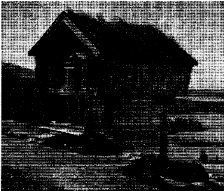
Fra Gardsjord i Rauland