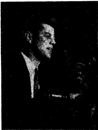
Kennedy har innsatt en administrasjon av marxister — —

«La oss være fair overfor Kennedy og se kjennsgjeringene i øynene», skriver Common Sense