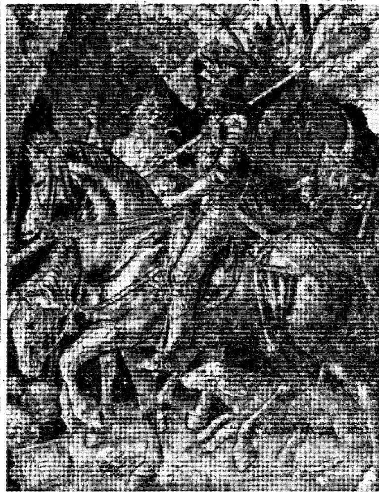
Dürers dystre tegning «Ritter, Tod und Teufel» synes å være mynet på dagens situasjon.