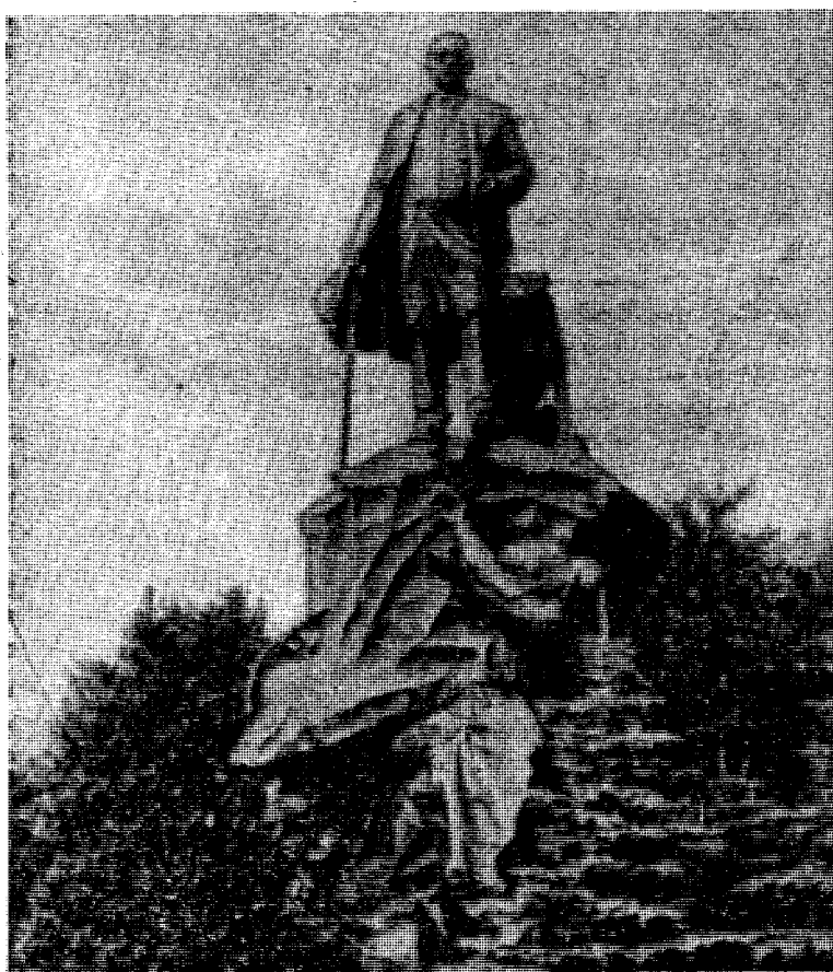
Bismarckminnesmerket i Leipzig viser jernkansleren stående på en klippeblokk med hunde Tyras ved sin side. En arbeider rekker i taknemlighet han som smidde den tyske enhet en ekegren. Hvorledes forvaltes Bismarcks arv i dag?