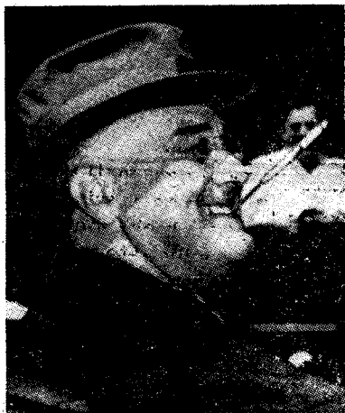
Også FN er en sørgelig arv etter Roosevelt.

Dengang gallerne omkring år 300 før Kristus trengte inn i Roma og kom opp i senafet, ble de slått med forbauelse ved synet av de hvitkledte senatsmedlemmer som koldblodig satt på sine plasser. De så ut som guder, tenkte gallerne. Det var først da én nappet gudene i skjegget at de forstod de var mennesker.