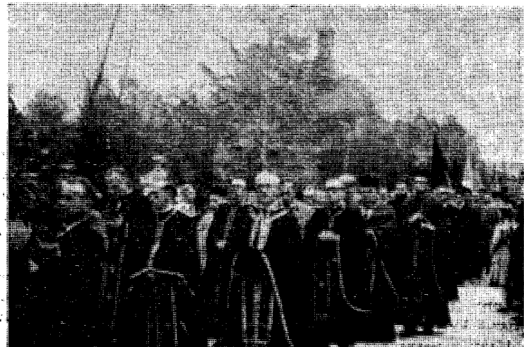
Originalfoto for FOLK OG LAND fra Banderas begravelse. Det gresk katolske presteskap på vei til graven.

BETRAKTNINGER I TILKNYTNING TIL MORDET PÅ DEN UKRAINSKE EMIGRANTFØRER STEFAN BANDERA