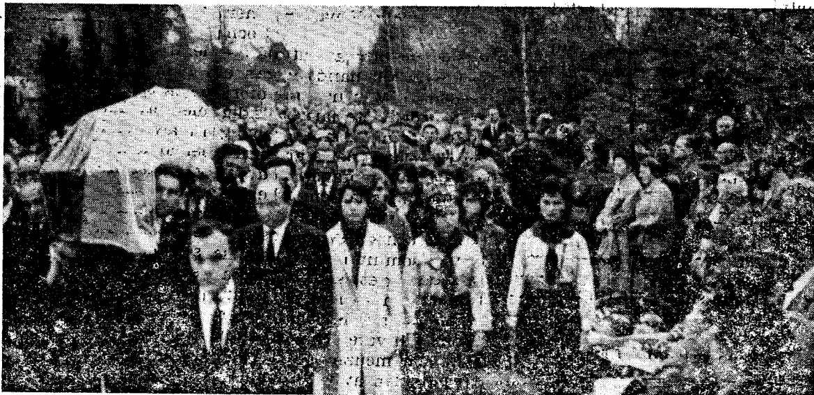
Banderas kiste dekket med det ukrainske blågule flagg.

FN som nu er adskillig kulørt synes å være av den oppfatning at straks den kulørte befolkning er i flertall i et område skal den overta styret og stellet og forvalte det den hvite mann har arbeidet opp gjennom århundreder. FN spør ikke etter om dette kulørte flertallet er kultivert nok til å overta makten. Det spør bare om det er flertall. Ut fra dette syn har FN henryndt seg til Syd-Afrika-Sambandet, men er blitt avvist. Den hvite syd-afrikaner vil greie sine problemer selv og derfor tar FN nå sikte på Angola, som portugiserne har kultivert opp gjennom 500 år. Der forlanger nu de innfødte selvstyre. Det gikk jo ikke med terroren, med mord og brann, så nu forsøker de å nå (Forts. side 5)