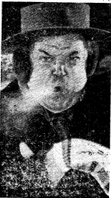
La oss vente og se!

Mån kan derfor gå ut fra som sikkert at FN's stab allerede fra starten av var ganske rødfarvet og at staben alltid med megen iver har fremholdt at organisasjonens hovedoppgave var å arbeide for verdensfreden, noe den da også har gjort under i alt 353 — tre hundre og femti tre — møter i Genève. Men om freden er snakket fremover i disse møtene er vel tvilsomt. Den er vel snarere blitt snakket lengere akterover om ikke helt i svime.