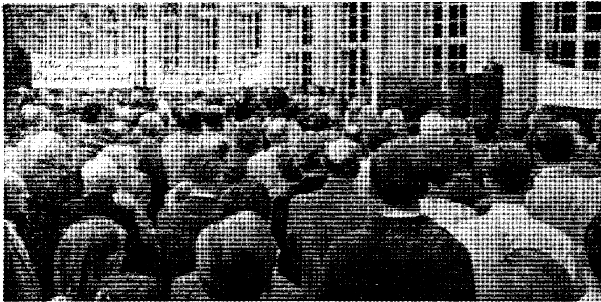
I forbindelse med Berlin-krisen var det demonstrasjoner for Tysklands enhet overalt. Men hva med utsiktene hvis Fellesmarkedet blir en resteuropsk forbundsstat?

Tysk stemme om bestrebelsene på politisk samling av Resteuropa