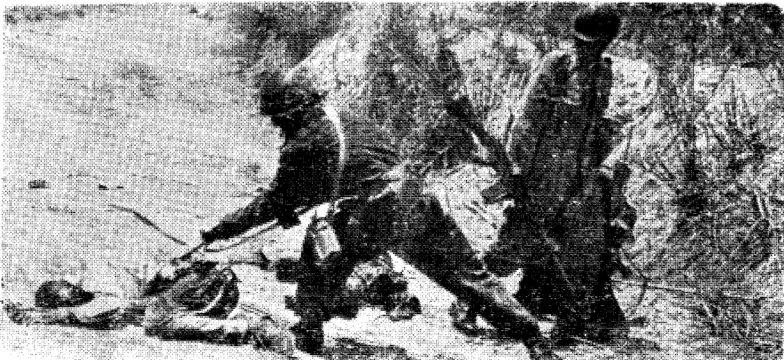
FN's innstans i Kongo bygger just på foreställningen, att de svarta endast behöva skolning och utbildning för att snabbt bliva ikvårdiga med den vita mannen — —

With the memory of the events of 1940 fresh in mind, I convey my greetings to Narvik in its jubilee year and to the Nordic Turistforening.