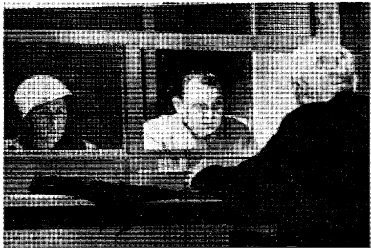
Riksmarskalk Göring konfererer med sin forsvarer dr. Stahmer

Skjønt han ble tvunget å vegetere under de mest kummerlige forhold, i en selle som dag og natt var opplyst av lyskastere, overtok Göring modig og klokt forsvaret av det tyske folk og Det tredje rike