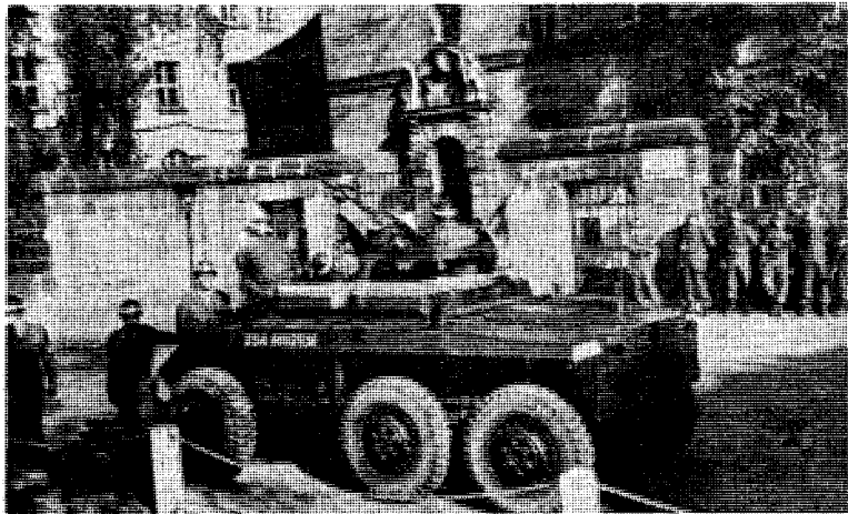
Justisbygningen i Nürnberg var under hele den såkalte prosess sikret dag og natt av tungtbevæpnede tropper og stridsvogner