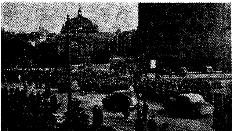
De første tyske tropper var allerede i Oslo.