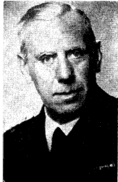
Den gåtefulle admiral Canaris