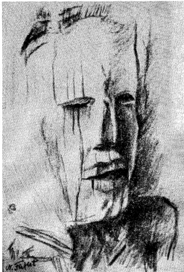
Mannshode (hugget og skaaret ut av en kort tykk trestamme).

Vel var Johan Scharffenberg en politisk motstander av NS, men han var ikke villig til å gi avkall på sannhet og rett av den grunn. Dagens Establishment vil bare huske det første.