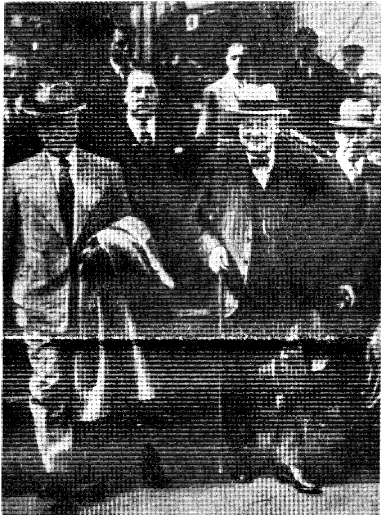
Churchill var hovedkraften bak de alliertes kyniske spill i 1939—40. Her er han i full sving i 1939.

Mange folk — spesielt briter og nordmenn — nærer den illusjon at de på et slags vis er bedre enn andre, mere moralske og idealistiske enn andre. De rasjonaliserer bort sin mere tvisomme politikk og handlinger gjennom å tillegge seg selv rene motiver og ta til inntekt for seg selv det jesuitiske valg-sprog at hensikten helliger midlet.