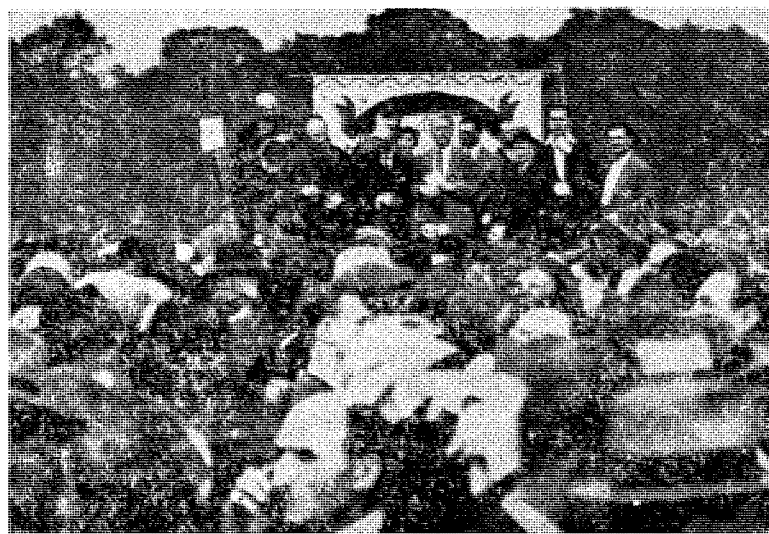
Dengang som nå: Jødene demonstrerer mot Det tredje Rike som de nå demonstrerer mot Sovjetsamveldet.

SLIK DEN I SIN TID GJORDE DET MOT HITLERS TYSKLAND