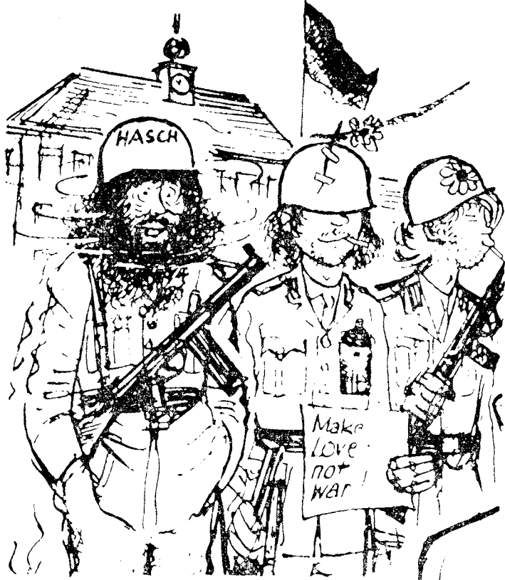
Med Fraserutvalget inn i det nye år!