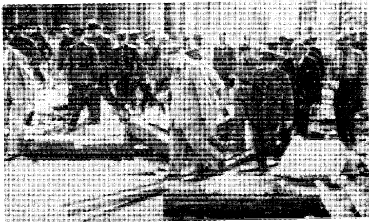
Churchill beskuer sitt verk i det utbombede Tyskland. Han forsøkte riktignok å bremse litt på Morgenthau og hans Presidentvenn Roosevelt, men gav kjøp da han trengte dollarstøtte. Heldigvis var det andre briter som var stivere i ryggen slik at Morgenthauplanen iallfall delvis kunne stanses.

Alle skal sprelle etter pengenes grimeskaft!