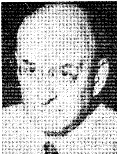
Roosevelts finansminister, Henry Morgenthau jr., som også ville dirigere utenrikspolitikken og ville tilintetgjøre Tyskland.