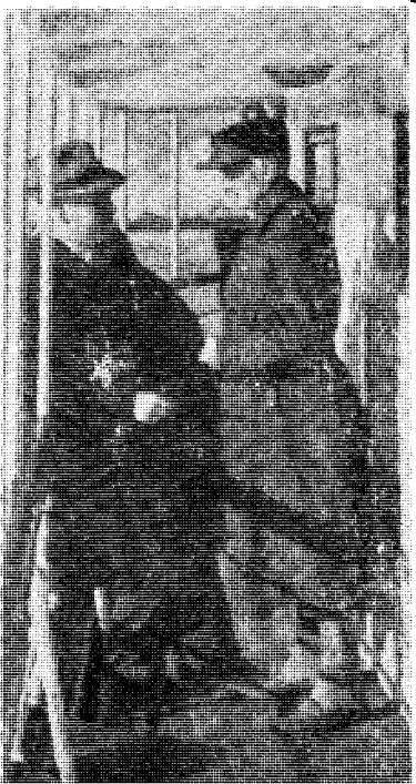
Den legendariske general Ruge tar avskjed med den flyktende Trygve Lie kort før han avslutter Norges krig.