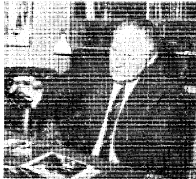
«Pappa Ashton» fra TV minnes sin «jakt på quislinger»

— Jeg hadde kapteins rang og skulle være adjutant til sjefen for de flybårne engelske divisjonene. Sammen med en kamerat skulle jeg være den første som «inntok» Oslo. — —