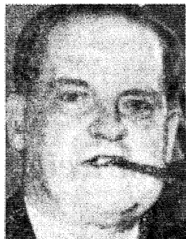
Herbert Wehner — mannen bak den farlige «østpolitikken», Stalins gamle medarbeider.

Willy Brandts østpolitikk har vært fremstillet som en ekte avspenningspolitikk, som en brobygging mellom øst og vest, og ut fra et slikt syn er det klart at hans politikk rent sikkerhetsmessig kan være en fordel for det lille Norge som ligger midt mellom de to stormaktsgrupperinger.