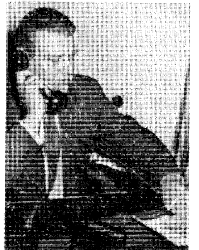
Skorzeny fotografert for noen år siden.

Ifølge Milano-avisen Il Giorno disponerer organisasjon (Forts. side 7)