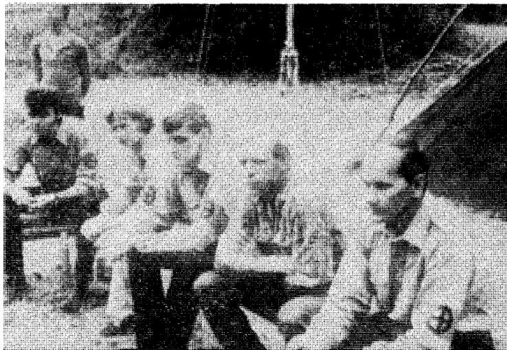
Dette var ikke ulovlig, sa retten.