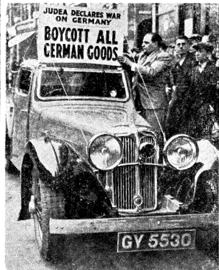
Slik begynte det: Den internasjonale jødedom erklærer Tyskland krig.