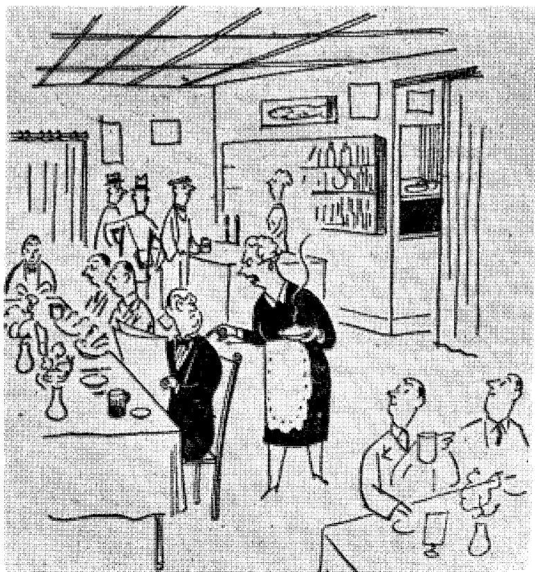
«Stekt torsk, er det Dem?»

I artikkelen ber Kleppe om å få komme med et hertesukk, han syntes det var «ganske drøyt» av kommunistavisen å offentliggjøre sikkerhetsgraderte dokumenter, samt å oppfordre militært personell til å bryte taushetsløfte. Er det slik vi skal oppfatte spionasje og landsforræderi i fremtiden? Som noe som er «ganske drøyt»? Vi håper ikke vi skal oppfatte forsvarsministeren slik og han føyer da også advarende til — «slikt tull må dere slutte med!»(!)