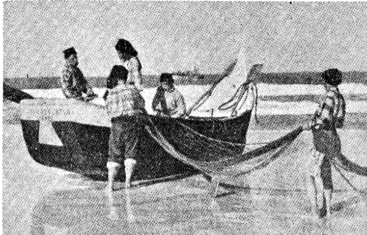
Portugisiske sardin fiskere, et produkt av raseblanding.

Verdensmakten Portugal, som blandet seg med negere og sank ned til ubetydelighet