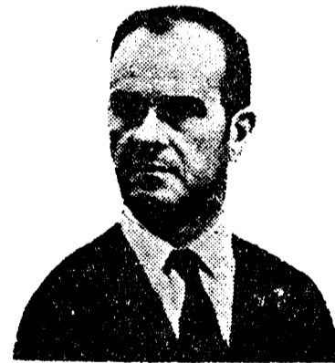
Georges Marchais — kommunistlederen som var tyskerarbeider.

Marchais' fortid som Hitlers og Görings frivillige arbeidsmann har vært trukket frem adskillige ganger under den valgkamp som ble avsluttet 11. mars ved at de